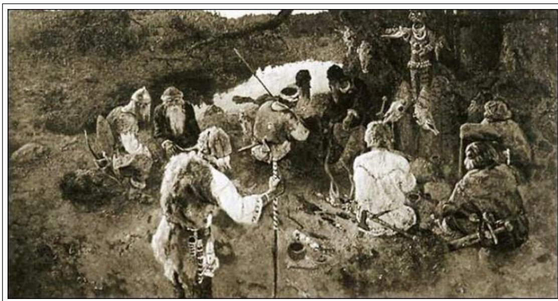
Н.К. Рерих. Сходятся старцы. 1898. (Ч/б воспроизведение)